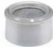
Distansring För tvättställ, utan bräddavlopp. Förkromad ABS. Art nr 8573606