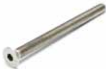
Skriv 50 mm Passar till samtliga Alterna Bottenventiler och används för tunna tvättställ. Art nr 243208