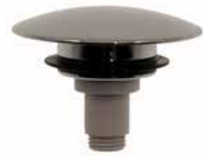
Pop-Up Plugg Passar till Art nr 8573578 Art nr 8573602