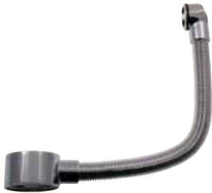
Distansring För tvättställ, med bräddavlopp. Förkromad mässing. Art nr 8573586