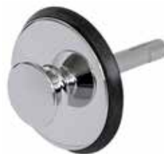
Plugg till vippluggventil Passar till Art nr 8573574, 8573582, 8573584, 8573585. Art nr 8573583