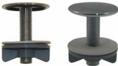
Täckbricka 43 mm med skruvtapp och vingmutter. Art nr 8348023