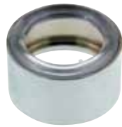
Distansring För tvättställ, utan bräddavlopp. Förkromad mässing. Art nr 8573587