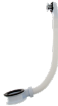
Distansring För tvättställ, vit i ABS med bräddavlopp. Art nr 8573605